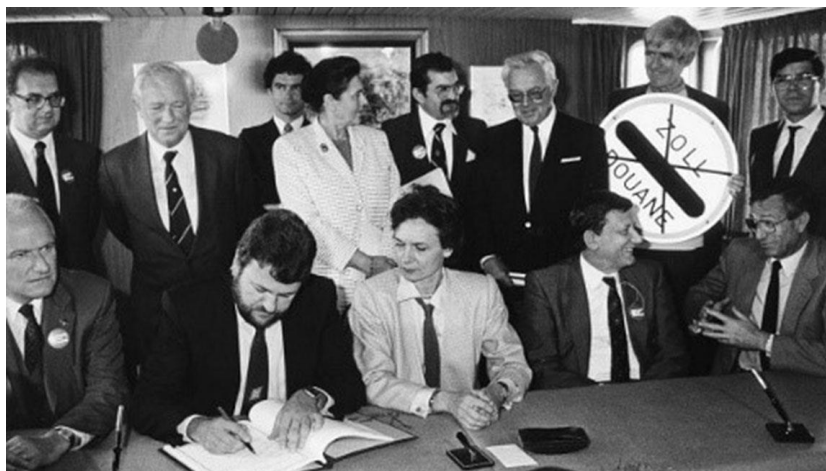
Podpisanie układu z Schengen (14 czerwca 1985)

Schengen to nazwa niewielkiej wsi w Luksemburgu, na granicy z Niemcami i Francją, gdzie – odpowiednio w 1985 r i w 1990 r. – podpisano układ z Schengen i konwencję z Schengen.